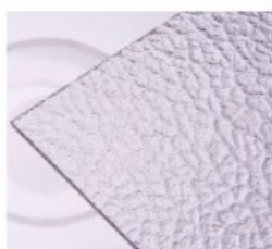
TK – dešťové kapky

□ nestandardní sortiment: dostupnost, množství a cena na poptání