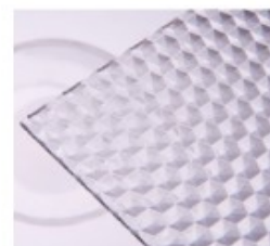
W – medové plástve

Prac. doba: Po-Pá 7,00-12,00 13,00-16,00 Změna cen vyhrazena.